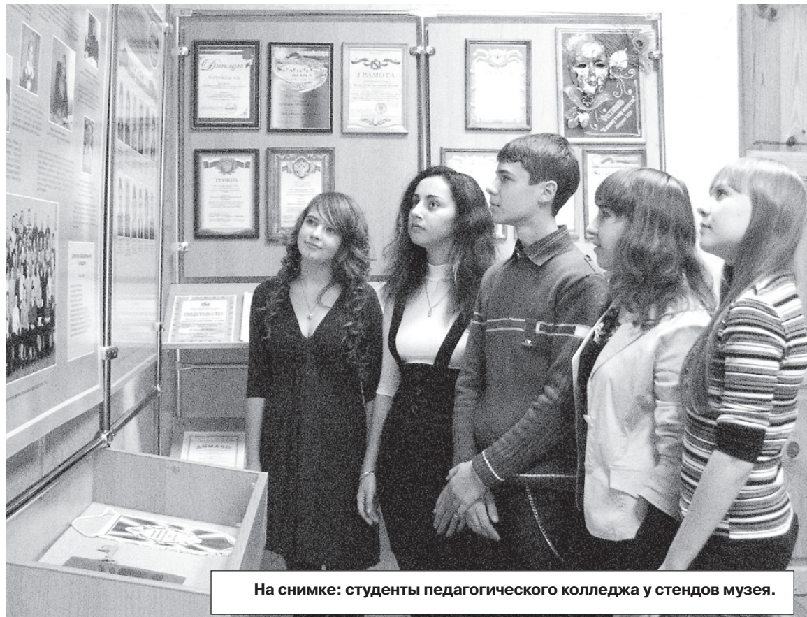
На снимке: студенты педагогического колледжа у стендов музея.

В связи с декабрьским 2010 года и мартовским 2011 года повышением фонда оплаты труда работников бюджетных учреждений области, с января 2011 года фонд оплаты труда работников муниципальных общеобразовательных учреждений увеличился на 510 миллионов рублей.