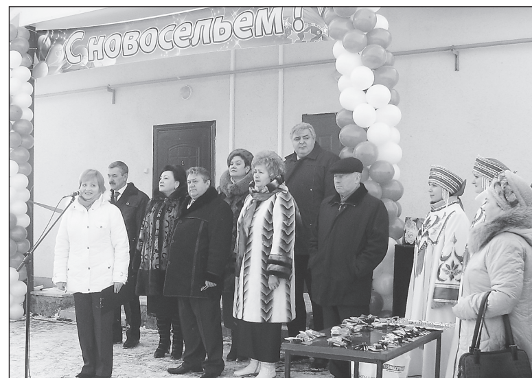
Дети-сироты получили ключи от долгожданных квартир.

- Как раз в последнее время обоянцы все чаще стали обращаться в администрацию города с заявлениями на выделение участков под строительство. Этому действительно предшествовал некий застой. Начали было горожане строить дома в районе ресторана, корбки возвели, а коммуникаций поблизости нет. Пришлось реагировать на их просьбы: сделать проект на газификацию ул. Циолковского. Газификацию произвели при софинансировании жителей. Как говорится, век живи - век учишься. В этом году к домикам, построенным для детей-сирот, мы провели все жизненно необходимые коммуникации - водопровод, газ и электричество. Это позволит протянуть голубое топливо и дальше по этой улице, и прилегающим к ней территориям. Кроме того, мы заказали проектно-сметную документацию на проведение на тех же участках водопроводной сети.