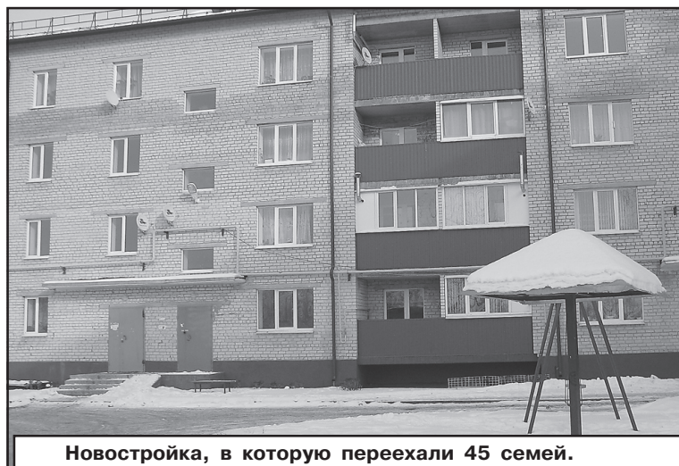
Новостройка, в которую переехали 45 семей.

ственную работу насосная станция третьего подъема начнет выполнять ближе к маю.