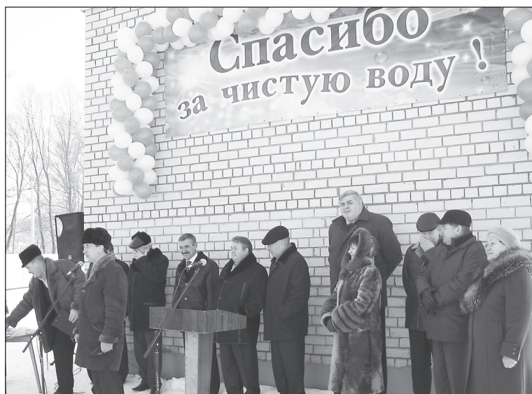
Завершилось строительство насосной станции третьего подъема.