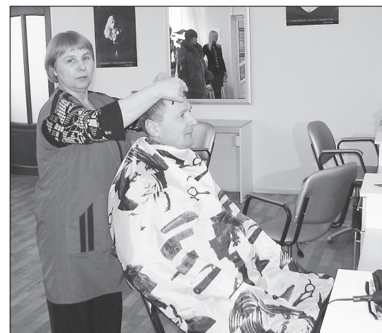
Современная парикмахерская в Доме Быта.

- Секрета нет: удается привлекать денежные средства из областного и федерального бюджетов.